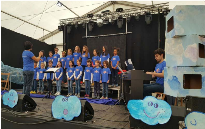
Concert a l'envelat dedicat al Petit Bernat