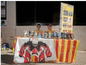
Figura 5. Tabalers de les escoles