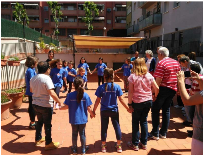
Visita a la residència ALB-BOSC de Mollet