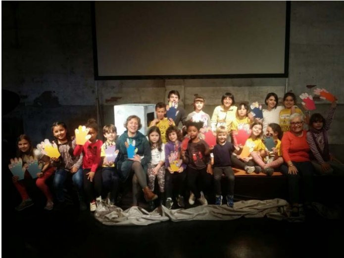
Final del taller de plàstica per preparar la cantata Sentiments i emocions

El curs 2016/2017 es va començar el 16 de setembre, amb uns 20 cantaires. D'aquests, dos provenen de Serveis Socials.